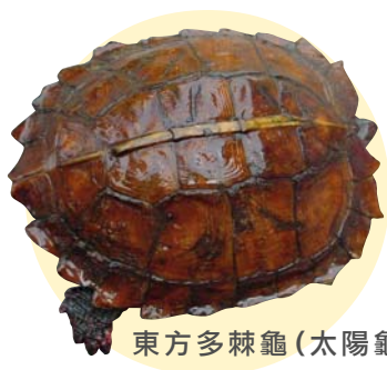
東方多棘龜(太陽龜)