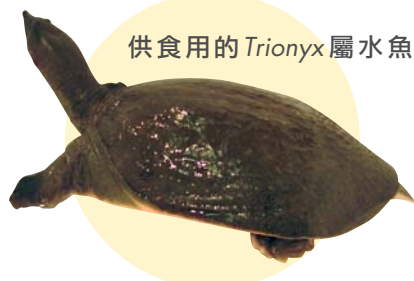
供食用的 Trionyx 屬水魚