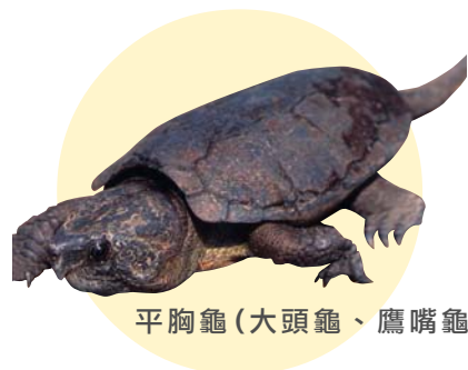
平胸龜(大頭龜、鷹嘴龜)