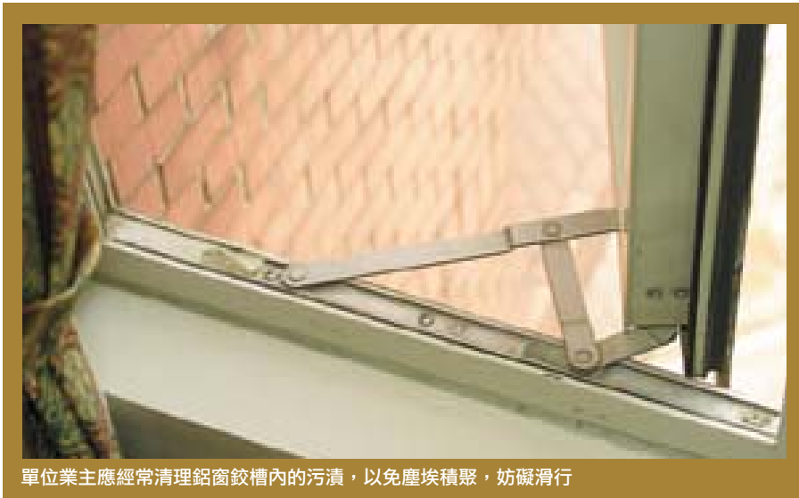
單位業主應經常清理鋁窗鉸槽內的污漬，以免塵埃積聚，妨礙滑行

工，確保安裝妥當。為確保素質及安全，個別業主應選擇信譽良好的裝修或鋁窗公司進行安裝及維修。此外，市民亦應提防一些以虛假地址招攬生意的鋁窗公司，他們的手法可能是在公司卡片或宣傳單張印上傳呼電話及虛假地址，收了錢後馬虎了事、偷工減料，對消費者毫無保障。市民光顧任何裝修或鋁窗公司前，應先親自到店舖查看，以確定有此店舖存在營業。