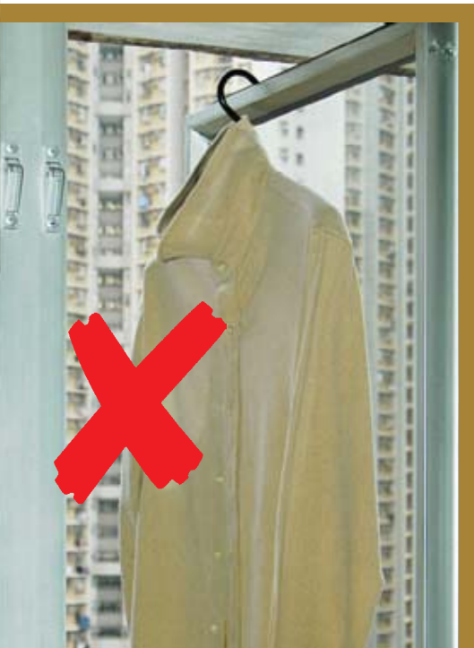
切勿於鋁窗及窗鉸掛放任何物件，以免窗鉸額外受壓變形

懸掛重物於窗戶，會使窗鉸承受額外壓力，並超出負荷，減低其耐用性或致變形。故此，切勿貪方便把洗好的衣服掛在鋁窗上風乾，或在鋁窗上加裝曬衫杆、曬衣架等物件幫助晾曬。