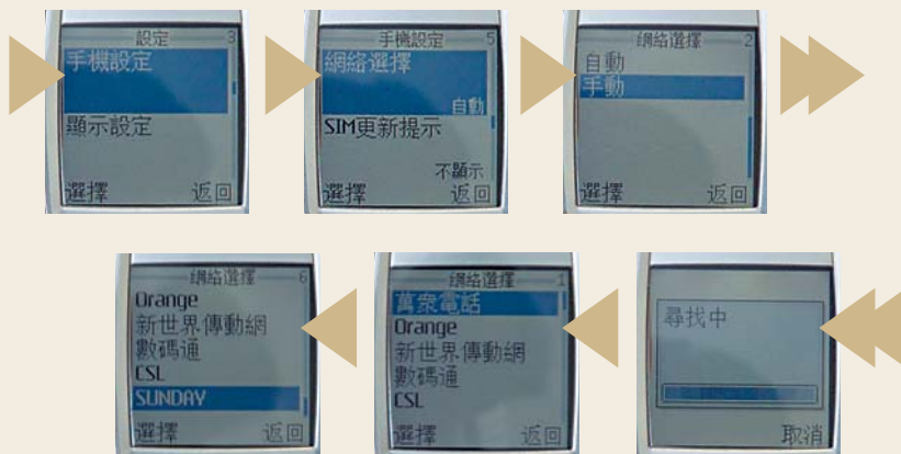
拣选自己所用的网络商

偶有听闻近边境的市民出现「人在香港,但被无端收取流动电话漫游费」的情形,用户应如何防止呢?