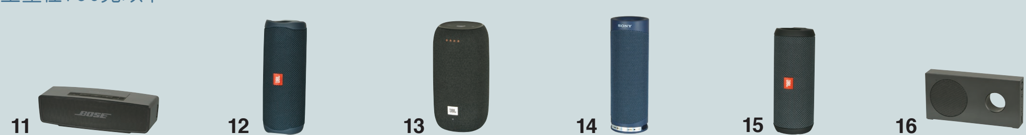
表一：藍牙揚聲器測試結果及型號資料