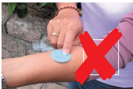
蚊怕貼不可貼在皮膚，而是貼在衣物上