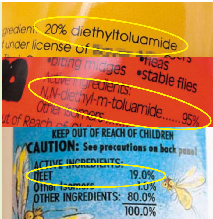
蚊怕水的「避蚊胺」名稱並不統一

市面上的蚊怕水，成分大多以英文標示，而所用名稱並不統一，如「避蚊胺」發現有下列英文名稱：「DEET」、「Diethyltoluamide」、「N,N-diethyl-metoluamide」、「N,N-diethyl-m-toluamide」及「N,N-diethyl-toluamide」等，消費者選購時難以掌握。此外亦有樣本標示成分中含「避蚊胺」的異構體 (Isomers)，即分子式相同但原子排列不同的「避蚊胺」。本會建議製造商考慮以較易明的中英文統一名稱標示驅蚊成分 (例如「避蚊胺」、「DEET」) 及其濃度，有助消費者比較不同型號的驅蚊產品。