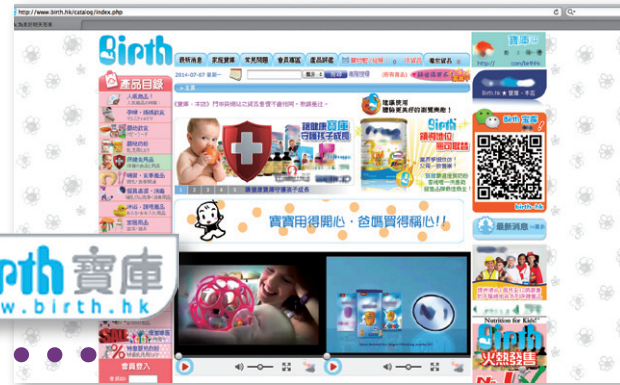
「寶庫購物網」的網站

今年7月，消費者委員會點名公布一家售賣嬰兒產品的網上商店，涉及以「不當地接受付款」及「先誘後轉銷售」的手法經營。這是本會首次公開譴責網上商店的不良營商手法，在社會上引起不少回響。