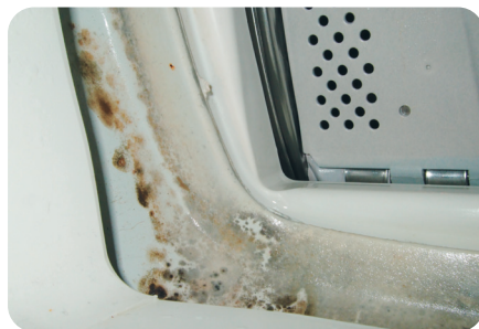
在塑膠封邊上的霉菌。

日常使用洗衣機清洗衣物，少不免殘留水垢 (limescale)、衣物纖維、毛髮和皮膚碎屑，甚至洗衣劑殘餘在洗衣機內，黏附在洗衣槽壁，在潮濕的環境，容易成為滋生細菌和霉菌的溫床，令洗衣槽發出異味，洗後的衣物亦可能因而沾上這些微生物。此外，洗衣劑和部分衣物柔順劑之間亦可能發生化學反應，形成一些蠟狀的物質，黏附在洗衣槽內不顯眼的地方，衣物亦可能因而受污染。因此，洗衣機也需要定期「洗白白」，確保洗衣機內槽和衣物的清潔衛生。