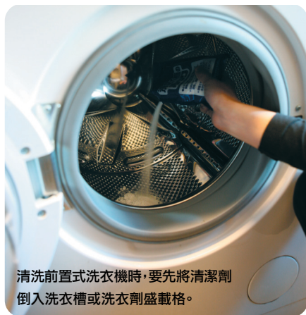
清洗前置式洗衣機時，要先將清潔劑倒入洗衣槽或洗衣劑盛載格。