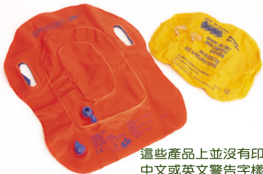
這些產品上並沒有印上中文或英文警告字樣

選購註明根據安全標準製造的產品，例如印有“CE”及“ST”等標誌的，在品質上會較有保證。消費者替兒童購買水上助浮物品，更應注意用品的尺碼及適用年齡，以策安全。該會又建議盡量避免買充氣式的助浮物品，如必須買的話，應小心檢查玩具表面有否破損，與及充氣的活塞是否利用單向閥的塞子，就算意外打開塞子仍可維持玩具在充氣狀態一段短時間。