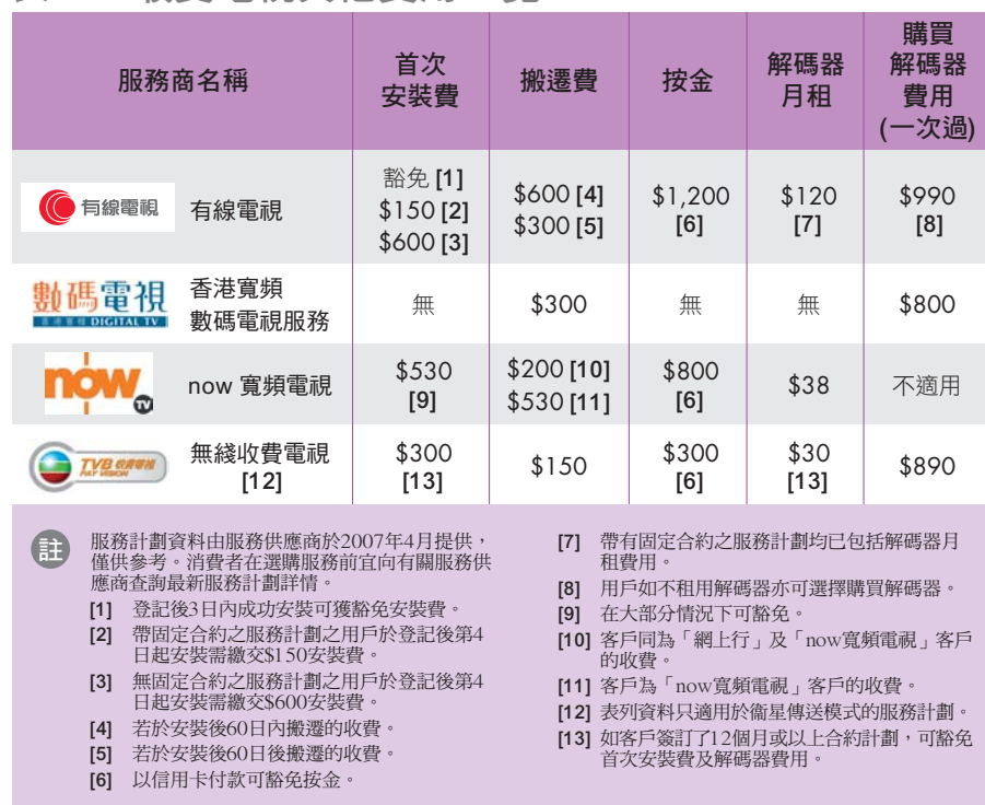
表二：收費電視其他費用一覽

時間（由12個月至24個月不等），若中途取消服務，需繳付合約剩餘期數的月費總額。