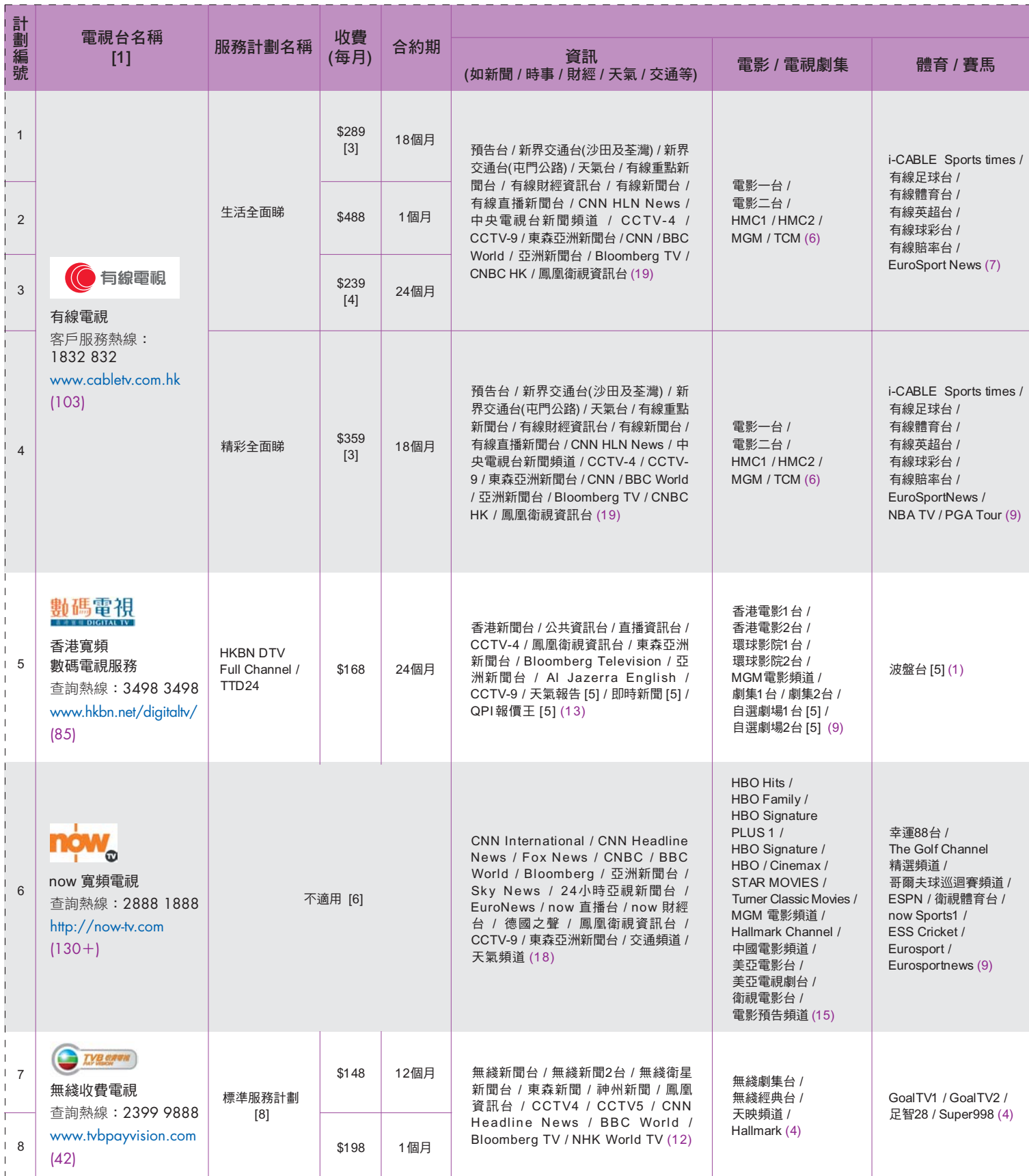
表一：部分收費電視服務計劃