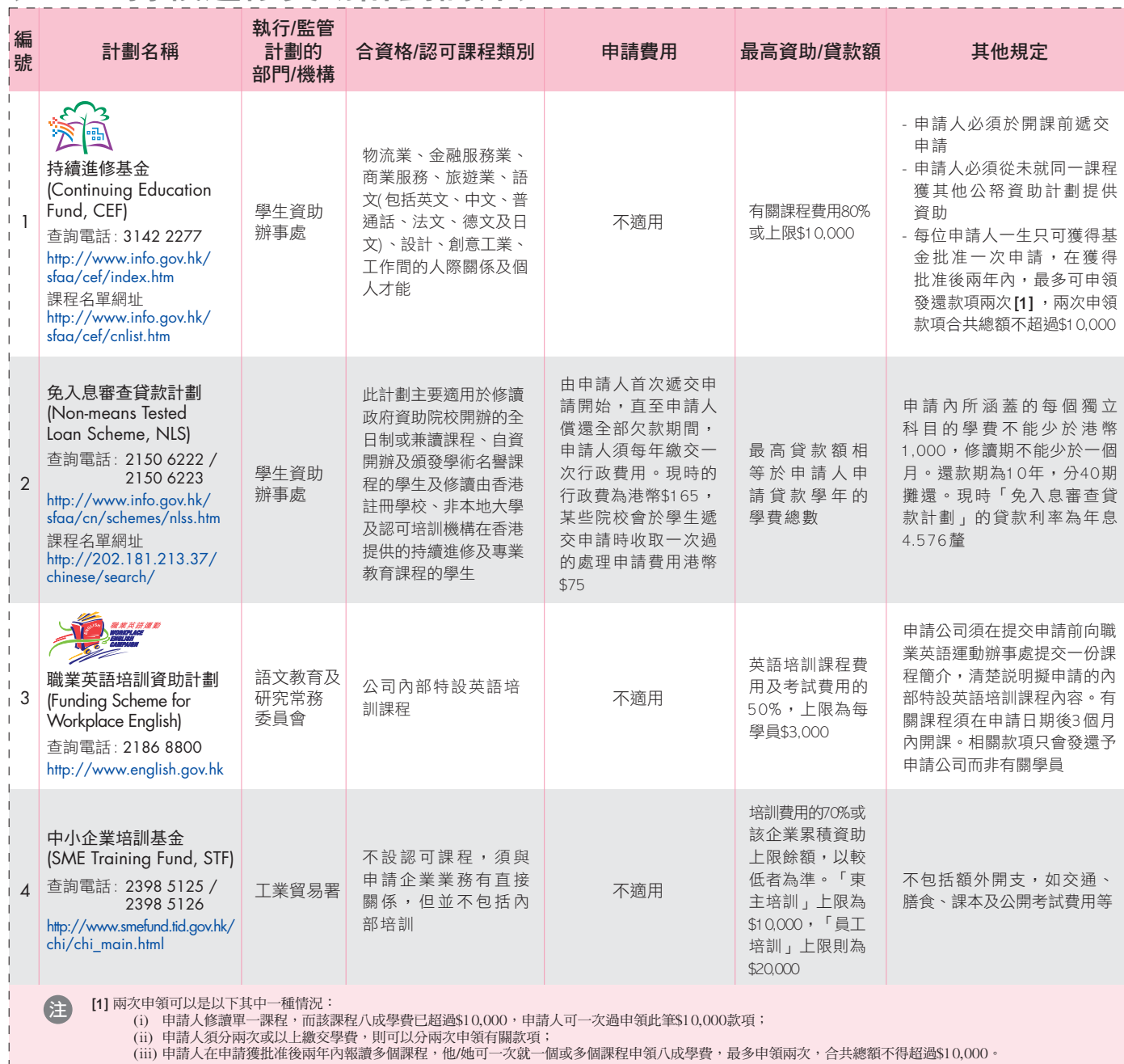
表一：持續進修資助計劃簡介表