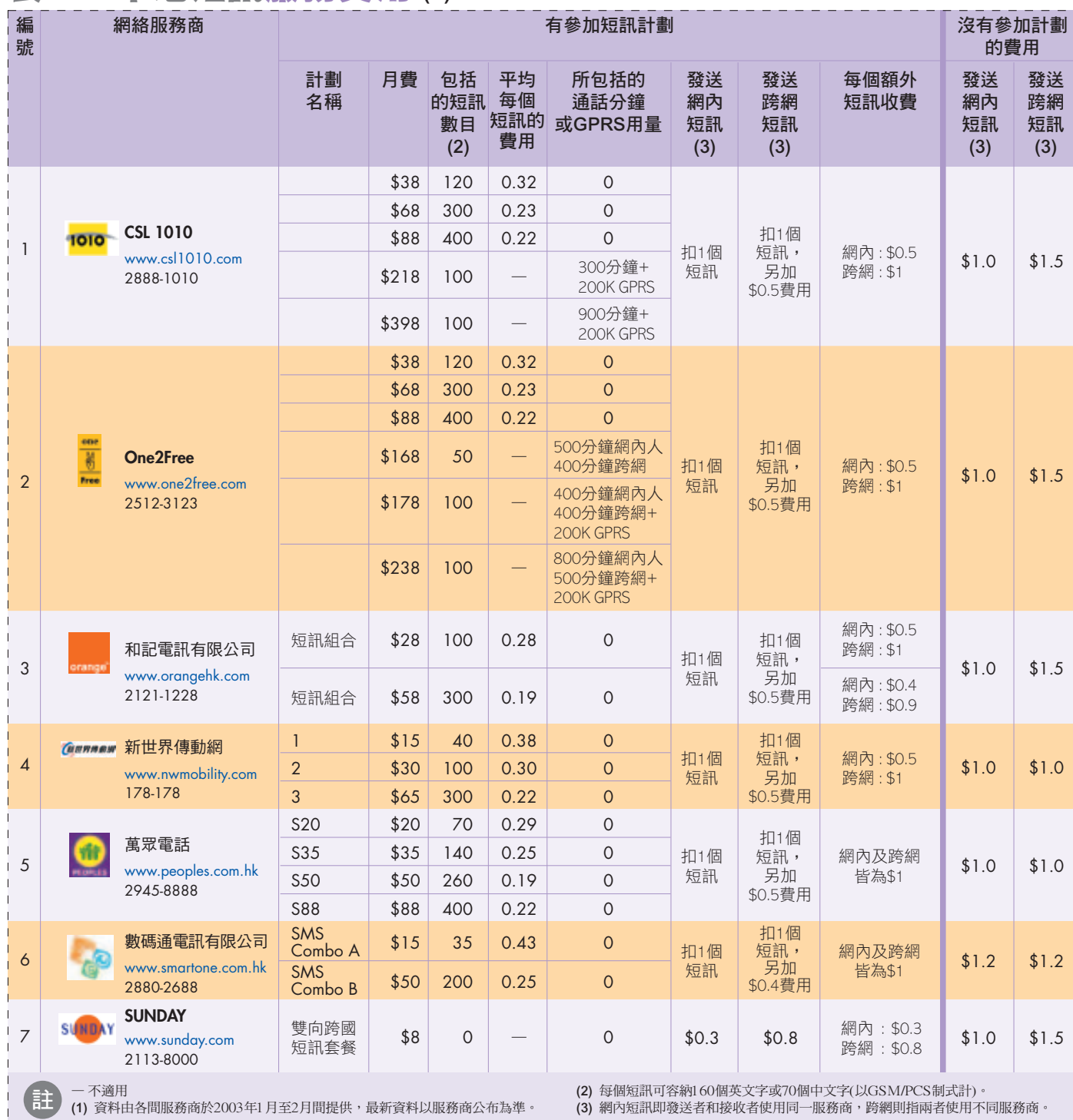
表一：本地短訊服務費用 (1)