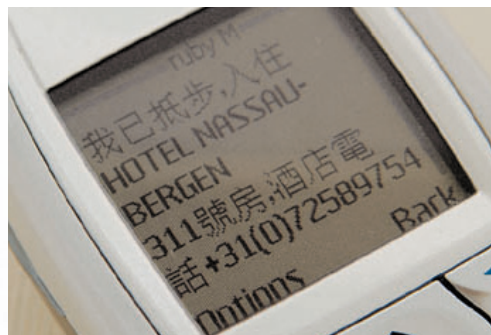
外遊到埗後，可發放短訊回港，費用約數元

此外，用戶也可在香港發放國際短訊給外地親友（發放時按「+」「國家字頭」「地區字頭」「對方手提